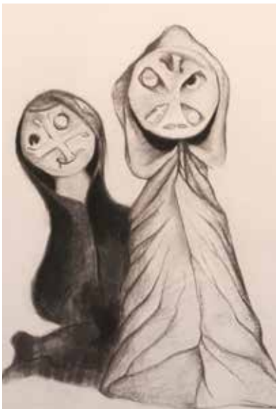
Charles Carrère, Les veuves discoïdales , détail

Trente-quatre dessins au fusain, du maître verrier Charles Carrère (1927-2021) récemment disparu, qui viennent faire écho aux thématiques abordées dans l'exposition permanente du Musée.