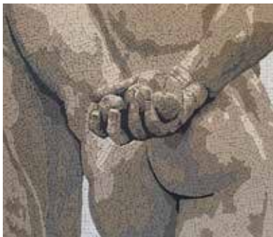
Goa. Corps et courbes

Exposition collective d'art et d'artisanat autour du thème de la sensualité.