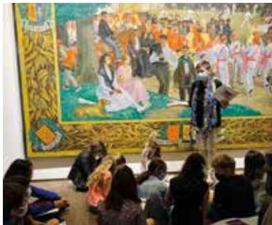
Le facteur des couleurs

Découverte du fandango à travers la peinture.