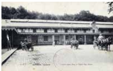
La Gare de Bayonne au XIX e siècle

En 1852, la Compagnie des chemins de fer du Midi reçoit la concession de la ligne Bordeaux-Bayonne. L'arrivée du chemin de fer va modifier l'actuel quartier Saint-Esprit dès le milieu du XIX e siècle.