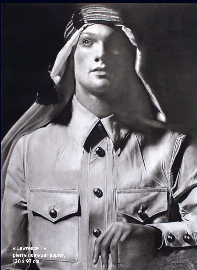
« Lawrence 1 » pierre noire sur papier, 130 x 97 cm

Guillaume Hérisson est ingénieur, musicologue et linguiste, il a fondé à New York, avec Kazumi Umeda, Harmonious Hedgehog Productions dédié à la réalisation de films sur des artistes contemporains. Kazumi Umeda est un compositeur newyorkais auteur et interprète multi-instrumentaliste. L'objectif du film est de plonger le spectateur dans le monde de Michel Haramboure, sans commentaire, sans aspect documentaire, par une pure expérience visuelle et musicale.