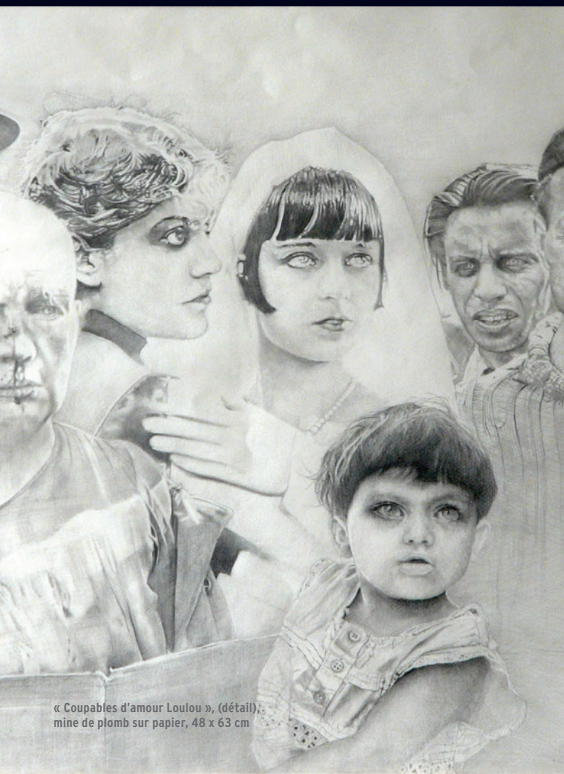
« Coupables d'amour Loulou », (détail) : mine de plomb sur papier, 48 x 63 cm