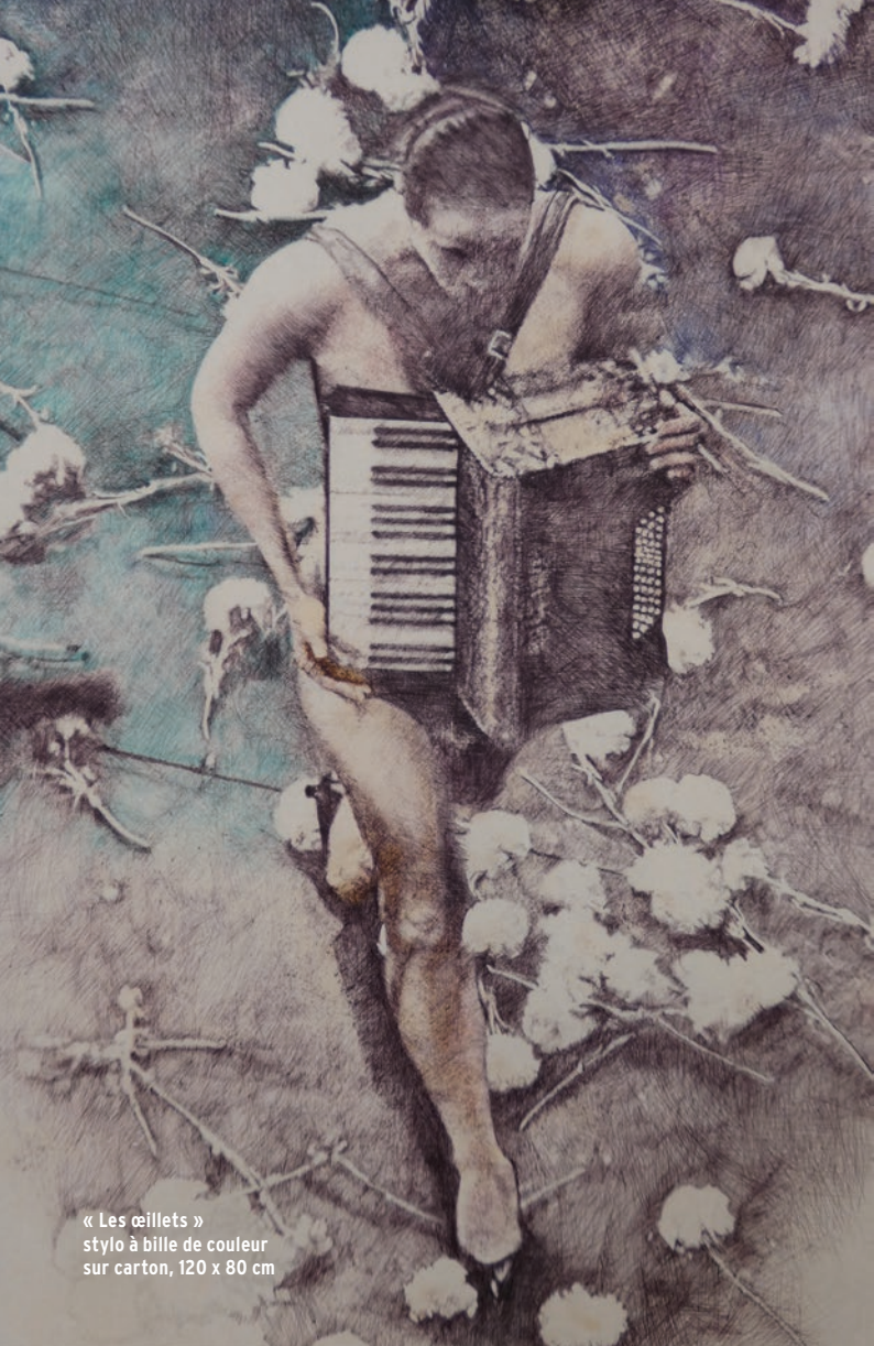
« Les œillets » stylo à bille de couleur sur carton, 120 x 80 cm