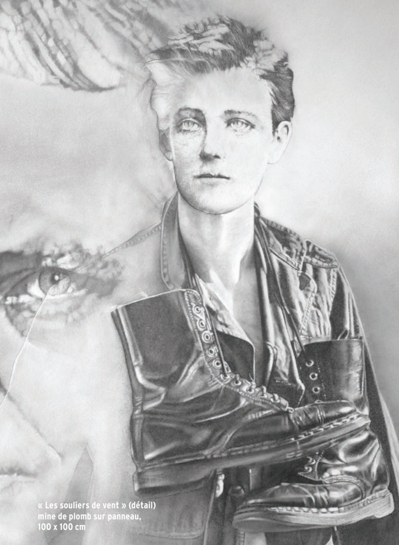
« Les souliers de vent » (détail) mine de plomb sur panneau, 100 x 100 cm