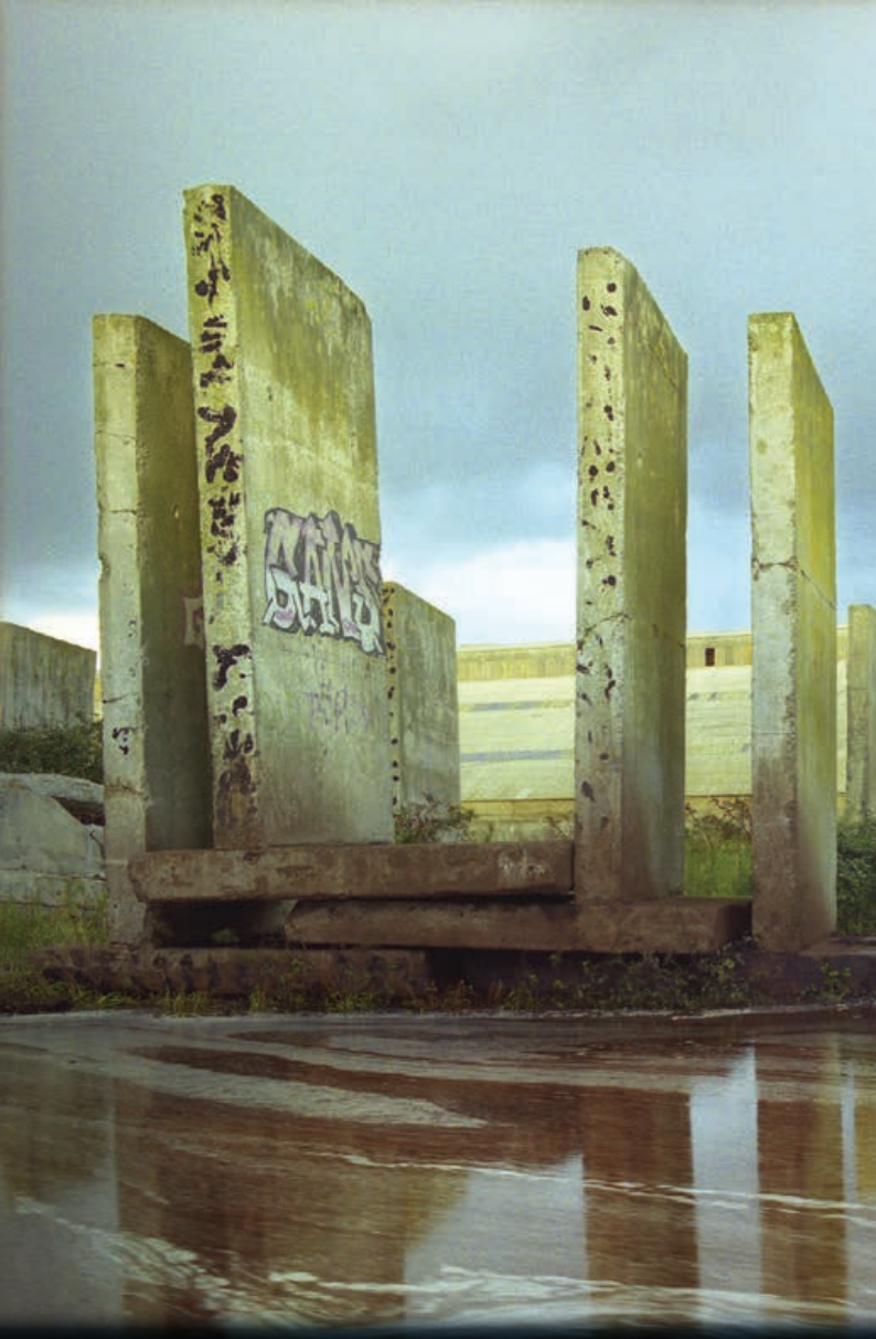
« Boucau », Luc Médrinal © Labo Estampe

DIDAM 6 QUAI DE LESSEPS – BAYONNE LESSEPS KAIA, 6 – BAIONA