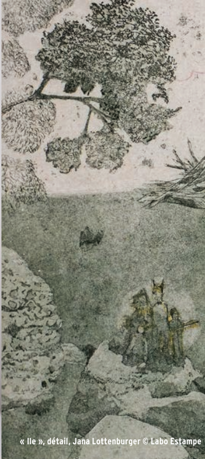
« Ile », détail, Jana Lottenburger © Labo Estampe