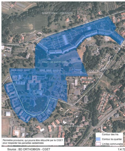
Quartier « Hauts-de-Sainte-Croix-Mounédé »

Les quartiers prioritaires de Bayonne sont historiquement des territoires d'accueil de nouveaux arrivants de cultures diverses.