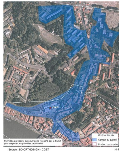
Quartier « Maubec-Citadelle »