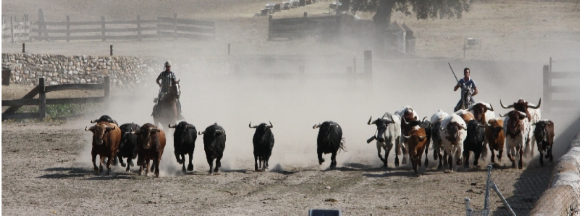
L'embarquement des toros de Garcigrande