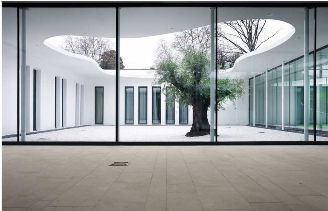
Patio des SDSEI de Bayonne © Leibar & Seigneurin