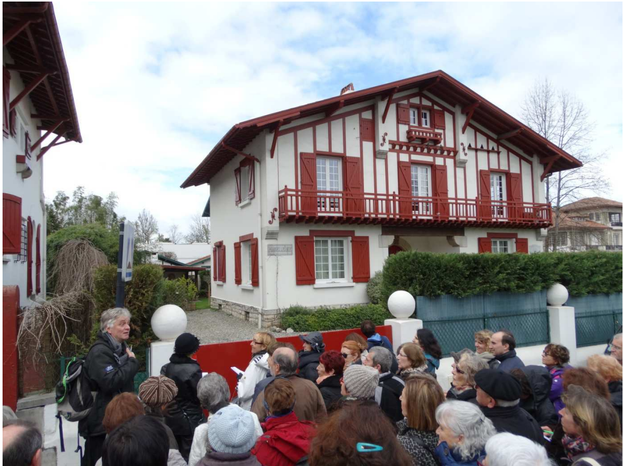
Visite des Allées Paulmy