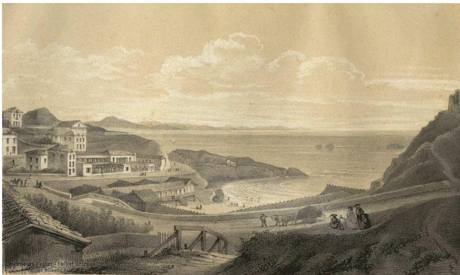
Blanche Hennebutte-Feillet, Biarritz : vue du port vieux et des deux établissements des Bains chauds et des Bains froids, [circa 1850], lithographie, Médiathèque de Bayonne.