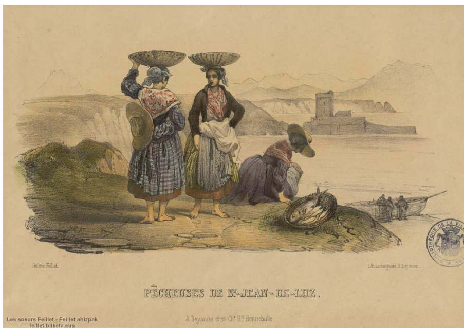
Hélène Feillet, Pêcheuses de Saint Jean de Luz , 2 e quart 19 e siècle, lithographie, Musée basque et de l'Histoire de Bayonne