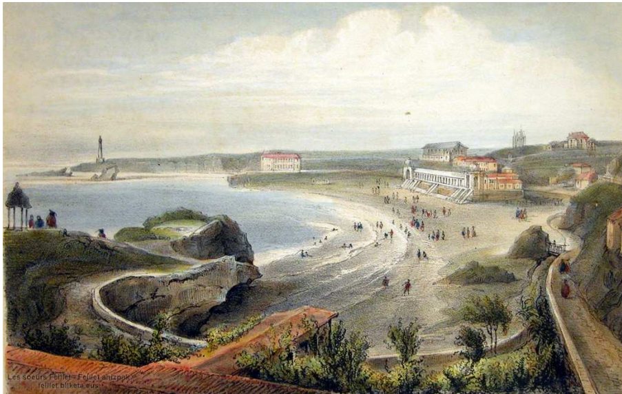
Blanche Hennebutte-Feillet, Biarritz, vue de la Côte des Fous, des Bains Napoléon, de la Villa et du Phare , Lithographie, Musée basque et de l'Histoire de Bayonne