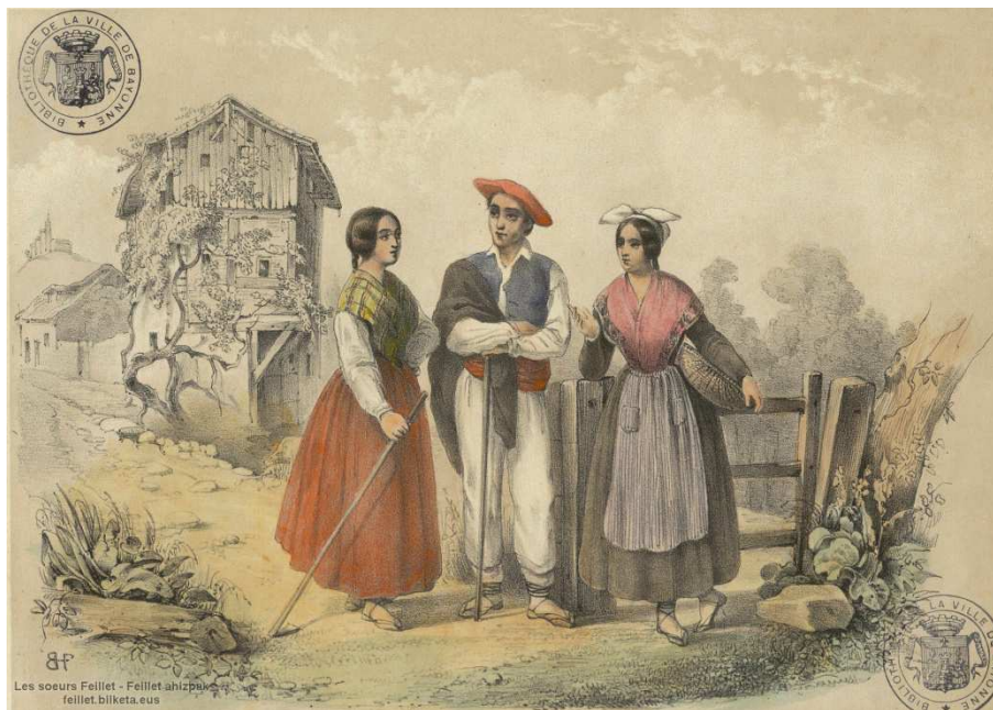
Blanche Hennebutte-Feillet, Azcoitia et ses environs, [1850], lithographie, Médiathèque de Bayonne