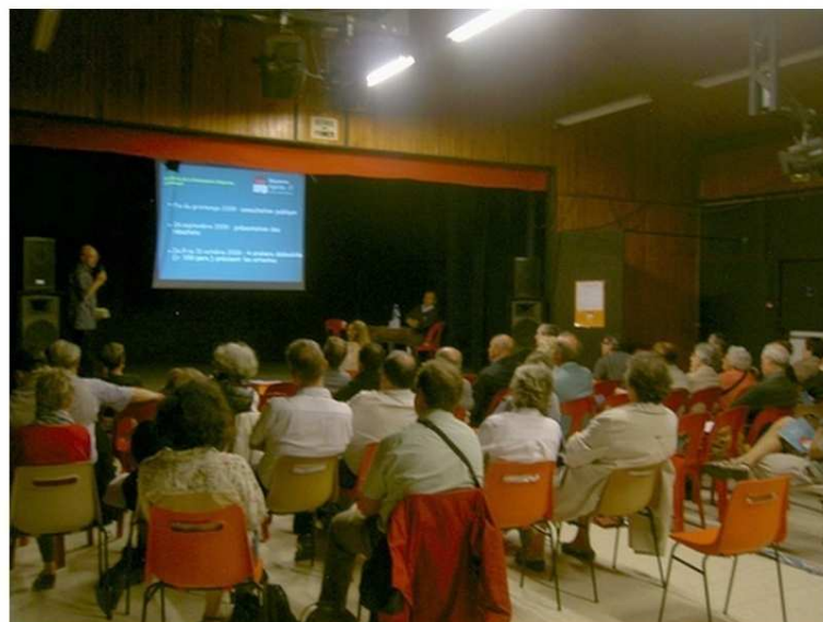
Les Participants sont attentifs...