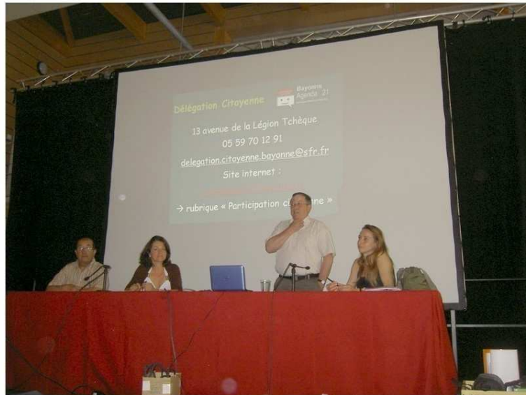
C'est Parti ! Première Assemblée de Secteur...