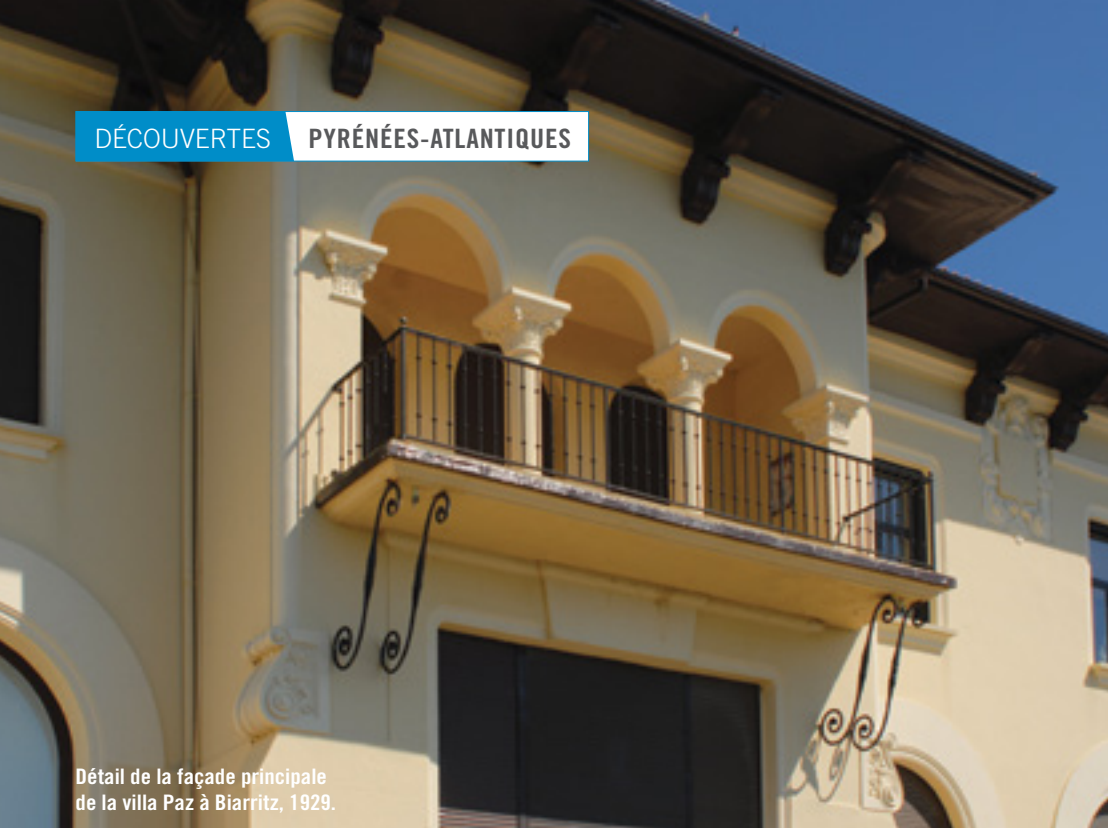
Détail de la façade principale de la villa Paz à Biarritz, 1929.