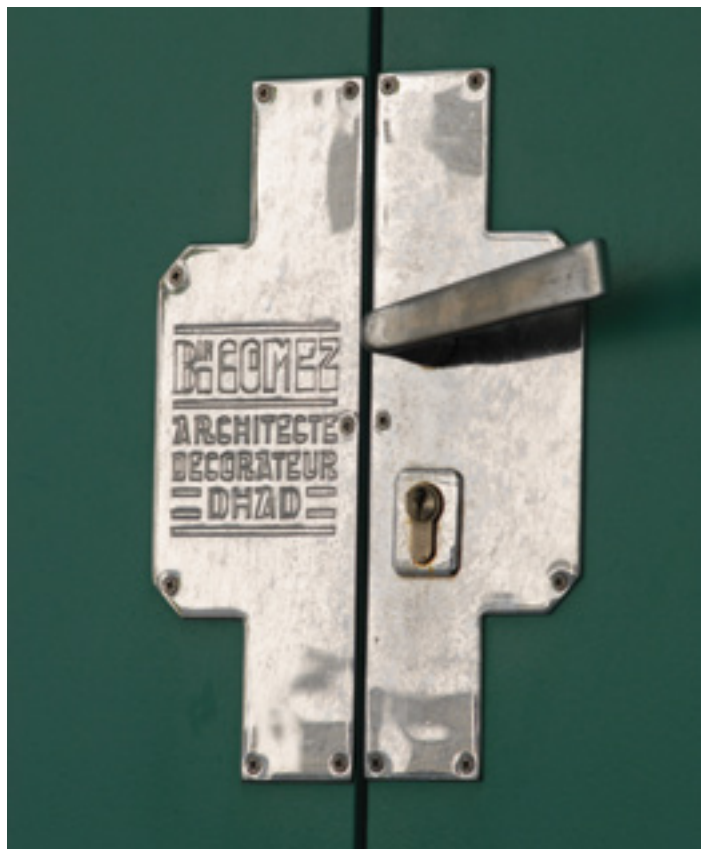
Détail de la villa Malaye, Bayonne, 1931.

officielle entre eux, seulement une entente absolue qui durera jusqu'à la cessation d'activité de Louis pour cause de maladie, en 1937. Cette solide entente se manifeste particulièrement dans la répartition de leur travail de conception. Ainsi, l'architecture revient plus naturellement à Louis, architecte diplômé par le gouvernement (DPLG), >>>