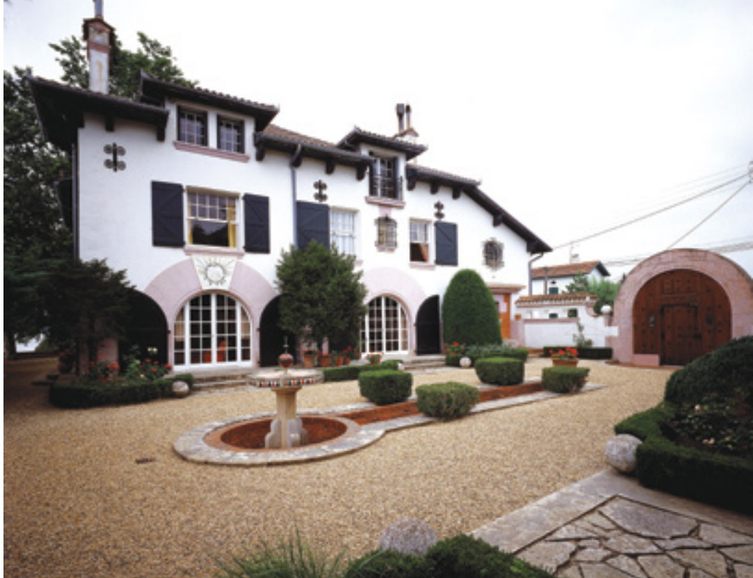
Villa Saint-Jean à Saint-Barthélémy, 1926.