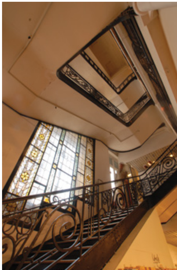
Ferronnerie et vitrail d'un grand magasin bayonnais.