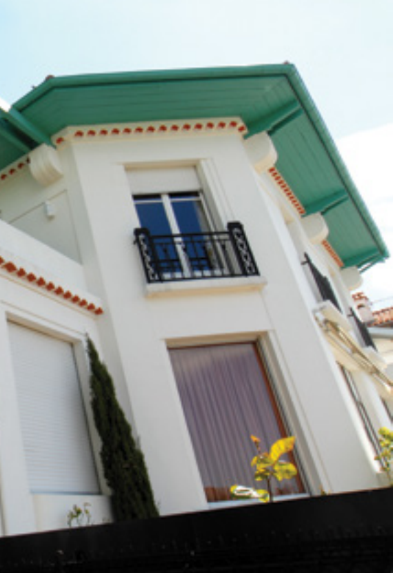
Ville Malaye à Bayonne, 1931.