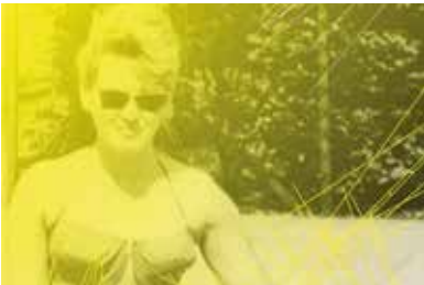
Mémoire de fille

Représentation suivie d'un bord de scène animé par le Planning familial.