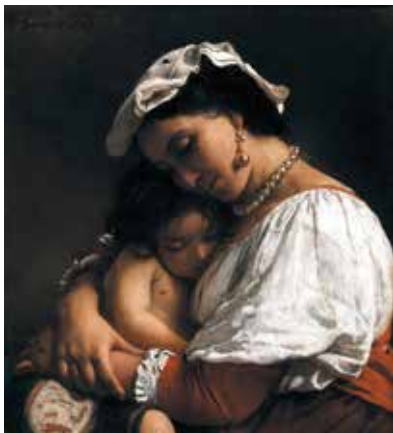
Léon Bonnat, Italienne , détail, 1872

À l'occasion de l'exposition consacrée à Marie Garay ce parcours chemine d'un tableau à l'autre, de médailles en décorations attribuées à des femmes et des hommes qui ont écrit une page de l'histoire de notre région ou de notre pays.