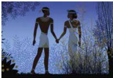
Le Pharaon, le Sauvage et la Princesse

3 contes, 3 époques, 3 univers : une épopée de l'Égypte antique, une légende médiévale d'Auvergne, une fantaisie du XVIII e siècle dans des costumes ottomans et des palais turcs.