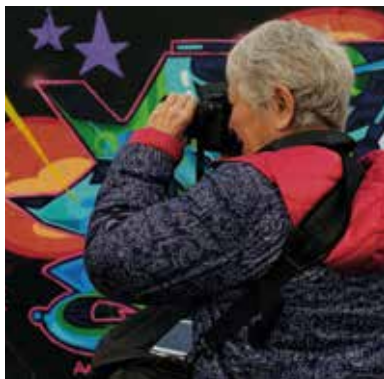
Martha : A picture story