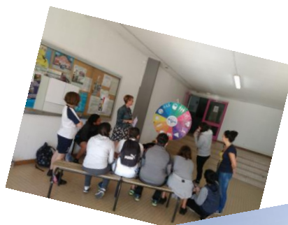
Rallye Découverte des activités sportives, de loisirs et culturelles Collège A. Camus 12 juin 2018

PRE/ASV - Rallye et ateliers « découverte » des collégiens : Promouvoir les activités sportives, culturelles et de loisirs