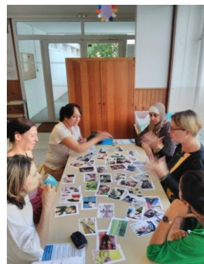
Stand Moi(s) Sans Tabac 24 octobre 18

ESCM, MVC St Etienne, épicerie sociale du CCAS à partir de janv. 2019