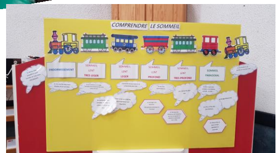
Atelier 1 : Que se passe-t-il quand on dort ?

Projet Sommeil, c'est la santé ! Atelier parents enfants « les p'tits rituels du soir »