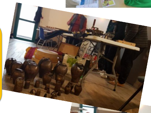
Atelier de la Mutualité Française: L'art d'entendre 12 novembre 2018

De nov. 2018 à fin 2019 et plus si affinité ☺